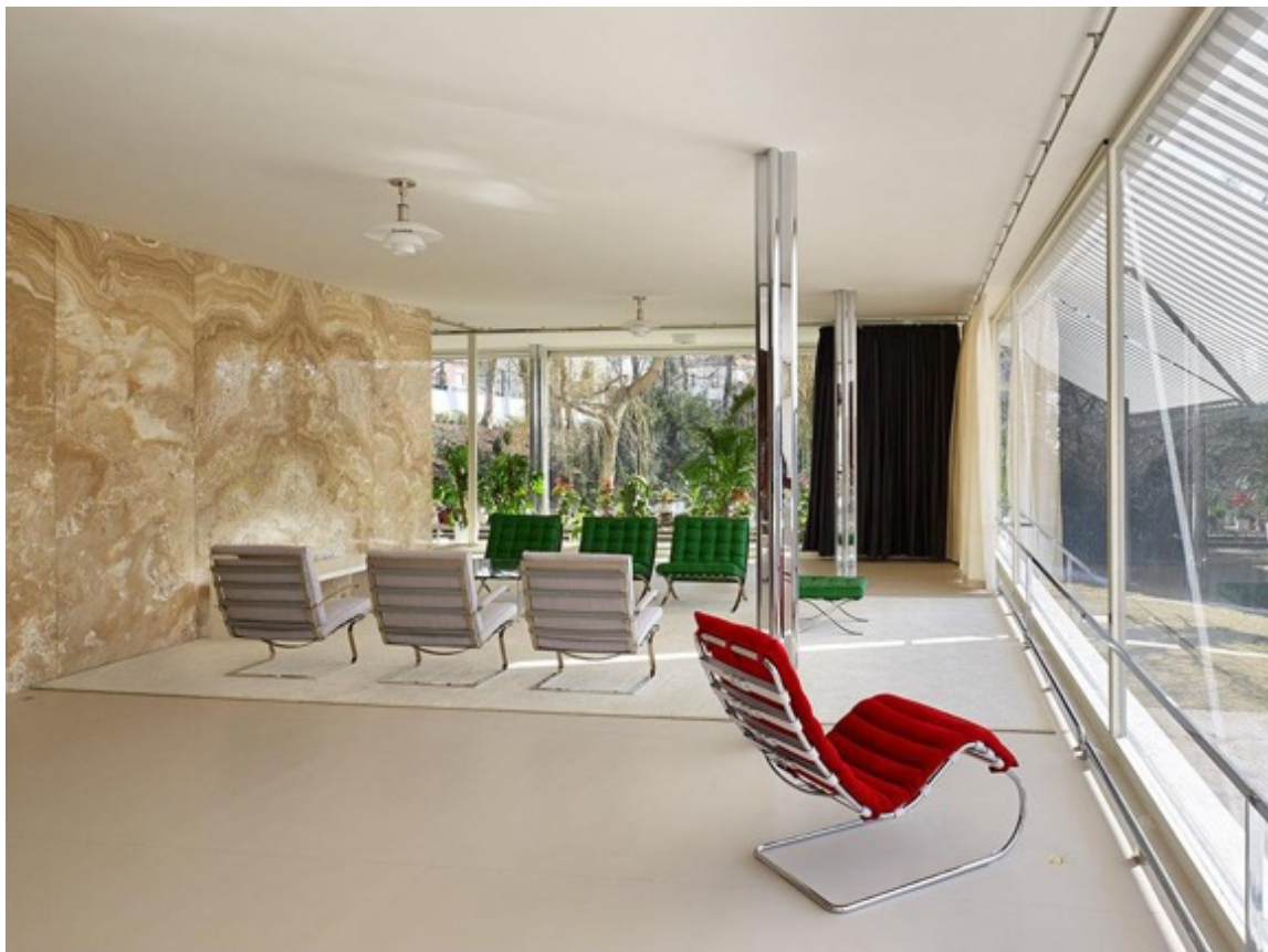
Haus Tugendhat, 2012.

Jetzt beginne ich zu verstehen: Die Entmaterialisierung und Entleerung des Raums, die Abstraktion von individueller Schönheit, von konkreter Materialität eröffnen den gedanklichen Raum für Nachdenken über die Menschen, die den Raum geschaffen, bewohnt und benutzt haben, für das Nachdenken über Geschichte, über Zeitlichkeit. Jetzt ahne ich auch, was mich in diesem Bild besonders anspricht. Es ist das Gefühl, das mich auch im realen Haus Tugendhat auch nach der 2012 abgeschlossenen Restaurierung angreift: Das restaurierte Haus ist wunderschön, es sieht aus, als ob es gerade erst fertig gebaut worden wäre, und es ist mit Möbelkopien eingerichtet wie eine perfekte Puppenstube, aber die Menschen, die in diesem Haus nur acht Jahre wohnen konnten, weil sie als Juden vor den heranrückenden Nazis 1938 fliehen mussten, diese Menschen sind nicht mehr da.