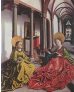
Konrad Witz, Die Heiligen Katharina und Maria Magdalena, um 1440, 161 × 131 cm, Tempera auf Holz, Musée de l'Œuvre Notre-Dame, Straßburg